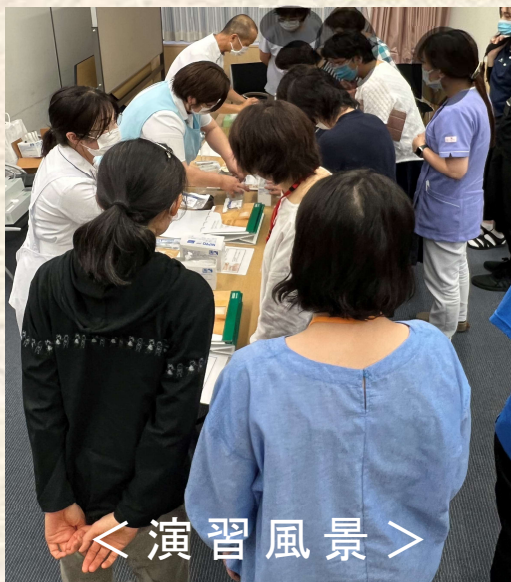
< 演習風景 >